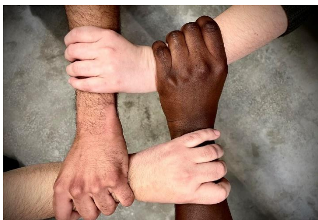
Photo réalisée spontanément par les salariés de Legend Services.

Des analyses permettent de vérifier ces engagements.